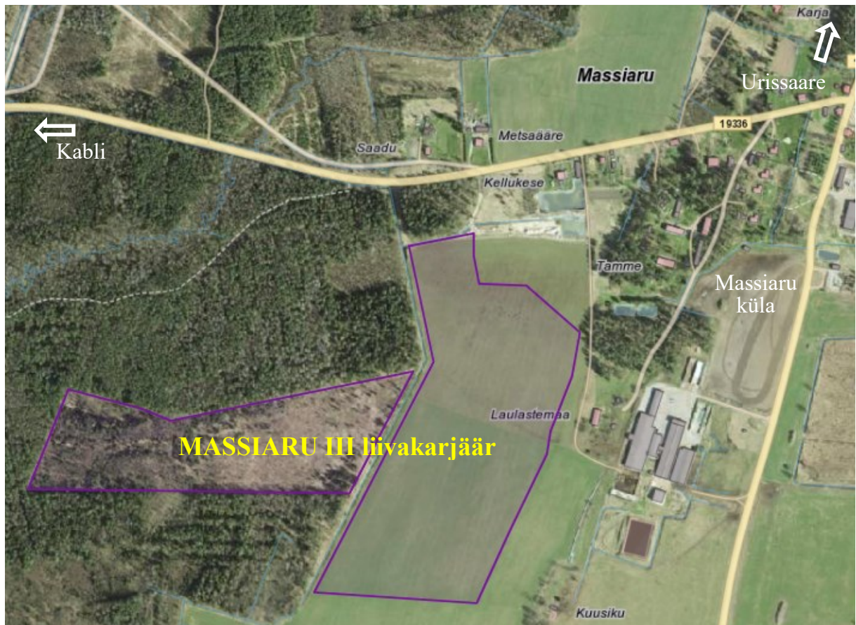
Joonis 1. Taotletav Massiaru III liivakarjääri ala (märgitud lilla kontuurjoonega).

KMH viiakse läbi keskkonnaloa (tegevusloa) andmise üle otsuse tegemiseks, sh loatingimuste määramiseks. KMH käigus hinnatakse kavandatava tegevuse ja selle alternatiivide mõju keskkonnale, tuuakse välja selle olulisus ning võimalikud leevendusmeetmed negatiivse mõju vähendamiseks või vältimiseks. Keskkonnamõju hindab KMH juhtekspert ja eksperdirühm koos arendajaga.